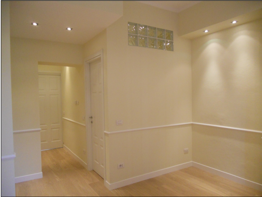
Vista Angolo cottura